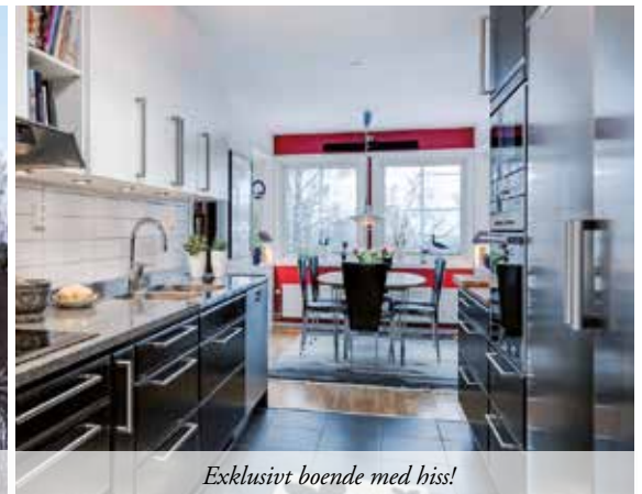
Exklusivt boende med hiss!

64 M 2 | VÅNING 2/5 | AVGIFT 4 897 KR | ACCEPTERAT PRIS 750 000 KR Markplanslägenhet på ett behagligt avstånd till centrum som har en härlig terrass med sjö och fjällutsikt. Hiss. *EP= 292 kWh/m 2 VISNING 27/1 16.00-16.30 & 31/1 14.30-15.00