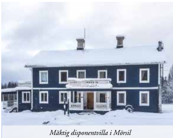
Mäktig disponentvilla i Mörsil

VÄNLIGEN RING 072-740 65 55 FÖR MER INFORMATION