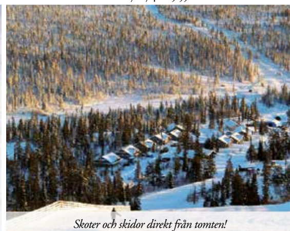
Skoter och skidor direkt från tomten!

TOMT 542-1 472 | PRIS 505 000-825 000 KR Nu har ni möjlighet att bygga ert drömhäus på en av Sveriges modernaste och mest expansiva fjälldestinationer! Köp nu, bygg i sommar och åk skidor i vinter! Liftkort i 5 år för familjen och vatten- och avloppsanslutning ingår.