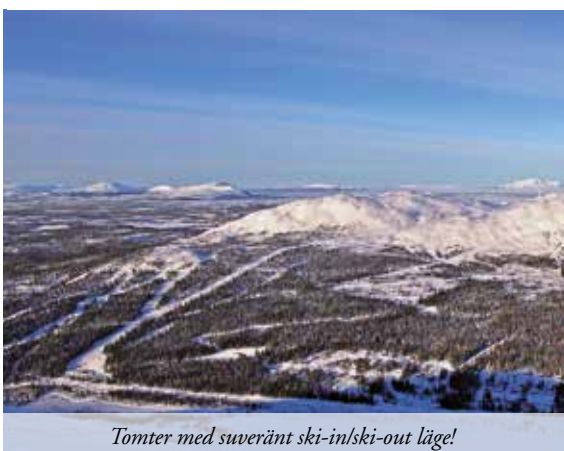
Tomter med suveränt ski-in/ski-out läge!

99 M 2 | 3 ROK | TOMT 1 355 M 2 | BYGGÅR 2014 | UTGÅNGSPRIS 3 200 000 KR Välkommen till en rymlig och välplanerad fjällstuga med både golvvärme, bastu och påkostat badrum. Stugan ligger högt och bjuder på en fantastisk utsikt över dalen! Varmt välkomna! VÄNLIGEN RING 072-740 65 55 FÖR VISNING!