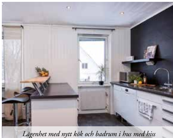
Lägenhet med nytt kök och badrum i hus med hiss

95,8 M 2 | VÅNING 2/3 | AVGIFT 7 163 KR | ACCEPTERAT PRIS 1 350 000 KR Helrenoverad lägenhet med påkostade materialval. Rymliga ytor och härligt ljusinsläpp. Lugnt läge och bekvämt boende med hiss. P-plats finns ledigt! Hiss finns i huset! EP* = 126 kWh/m 2 VISNING 31/1 11.00-11.45 & 3/2 17.00-17.30