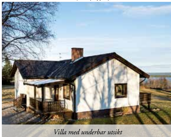
Villa med underbar utsikt

260+30 M 2 | ROK | TOMT 4 207 M 2 | ACCEPTERAT PRIS 1 175 000 KR Disponentvilla som har stora representativa sällskapsutrymmen med tidsenlig charm och vackra detaljer. Rummen erbjuder hög takhöjd och ger en glamorös känsla av rymd. Huset är rustikt och stora delar av huset har renoverats. Stor tomt i lugnt område. VISNING 6/2 11.00-12.00