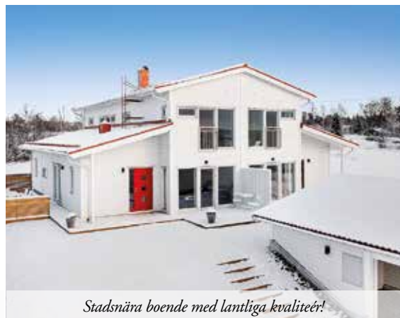
Stadsnära boende med lantliga kvaliteér!