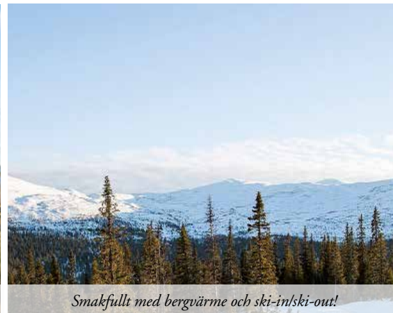
Smakfullt med bergvärme och ski-in/ski-out!

78+79 M 2 | 4 ROK | TOMT 1 340 M 2 | ACCEPTERAT PRIS 690 000 KR I familjära Vigge ligger denna trevliga villa som har en underbar utsikt över Storsjön och Hoverberg. Huset har en trivsamt planlösning med stort härligt vardagsrum samt utgång till altan med vacker milsvid utsikt över Storsjön. VÄNLIGEN RING 073-843 25 55 FÖR VISNING