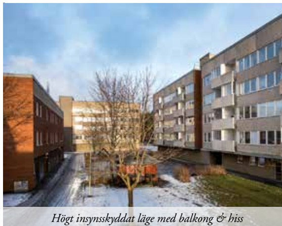
Högt insynskyddat läge med balkong & hiss

53,5 M 2 | VÅNING 2/3 | AVGIFT 4 193 KR | ACCEPTERAT PRIS 725 000 KR Genomgående renoverad ombyggd lägenhet i lugnt trivsamt område nära busshållplats och utsikt mot Storsjön. Nytt kök i öppen planlösning mot stor matplats. Vardagsrum med balkong samt nyrenoverat badrum med klinker och kakel. VISNING 27/1 16.30-17.00 & 31/1 14.30-15.00