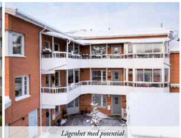
Lägenhet med potential

79,5 M 2 | VÅNING 4/4 | AVGIFT 3 202 KR | ACCEPTERAT PRIS 850 000 KR Välplanerad lägenhet med hiss och mycket ljusinsläpp från stora fönsterpartier. Vardagsrum i öppen planlösning mot matsalsdel. Två rymliga sovrum. Stabil förening med gott ekonomi. Närhet till stor matbutik och busshållplats. VISNING 31/1 12.00-12.30