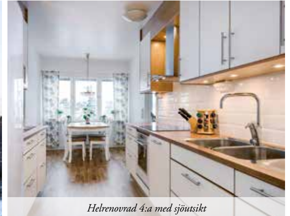
Helrenoverad 4:a med sjöutsikt

104+28 M 2 | 5 ROK | 3,1 HA | BYGGÅR 1934 | ACCEPTERAT PRIS 1 250 000 KR Med utsikt över fiskeparadiset Musviken ligger denna fastighet som kommer att kräva en hel del kärlek för att få komma till sin fulla rätt. Ett beviljat bygglov finns för fastigheten så det är bara att plocka fram hammaren och sågen för att sätta igång renoveringen. VISNING 30/1 KL 11.00-12.00