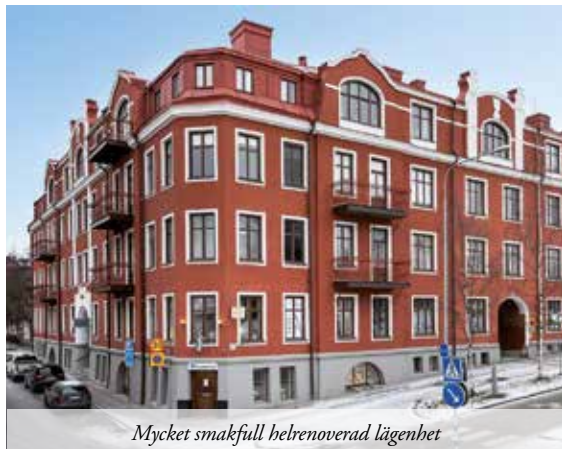
Mycket smakfull helrenoverad lägenhet

4:A SÖDER - BANGÅRDSGATAN 56 (uppg. 3) 100 M 2 | VÅNING 1/2 | AVGIFT 4 877 KR | ACCEPTERAT PRIS 1 450 000 KR Här bor du med bästa läget på söder! Välplanerad lägenhet med modernt och ljust kök. Uthyrningsdel och inglasad balkong med grym utsikt. Varmt välkomna! EP* = 136 kWh/m 2 VISNING 31/1 KL 13.30-14.15 & 2/2 17.30-18.00