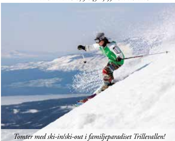
Tomter med ski-in/ski-out i familjeparadiset Trillevallen!

I 090-2 217 M 2 | BYGGRÄTT 280-320 M 2 BTA | PRISER FR 650 000 KR Nu har ni möjlighet att bygga ert drömhäus med fantastisk läge på Hovde-Högens fjällsluttning. Anslutningsavgifter för V/A och el ingår i tomtpriiset. LÄS MER PÅ WWW.STORSJÖMAKLARNA.SE