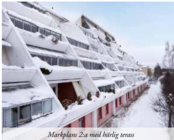
Markplans 2:a med härlig terrass

36 M 2 | VÅNING 1/3 | AVGIFT 1 452 KR | ACCEPTERAT PRIS 875 000 KR Praktisk helrenoverad bostadsrätt med lugnt insynskyddat läge ett stenkast från centrum i vackert sekelsifteshus. Modernt kök i öppen planlösning mot matplatsen och vardagsrummet. Avskärmd sovalkov. Nyrenoverat badrum. VISNING 27/1 17.30-18.00 & 31/1 15.30-16.00